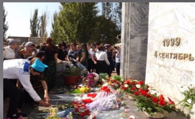
Возложение цветов к памятнику в Буйнакске