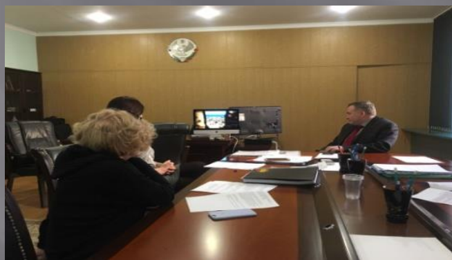
Отбор победителя конкурса на лучшую журналистскую работу