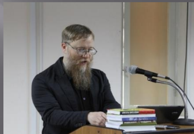
Выступающий на конференции в Национальной Библиотеке