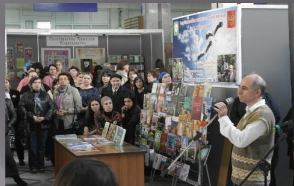
Книжная ярмарка в Тарки-Тау