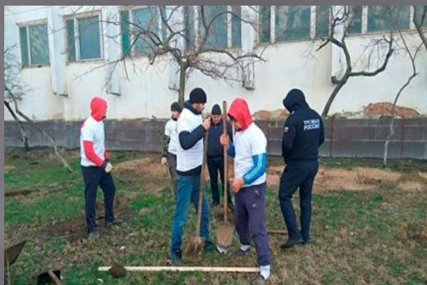
Работа по посадке Аллеи мира