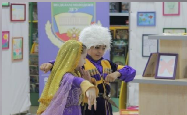
Выступление детей на конкурсе «Мир глазами детей»

Мининформом РД по этому направлению проведены такие мероприятия как: Организация детского творческого художественного конкурса «Мир глазами ребенка», Дагестанская книжная ярмарка «Тарки-Тау»; Республиканский конкурс по антитеррористической тематике на лучшую радио- и телепрограмму, телевизионный фильм, журналистскую работу.