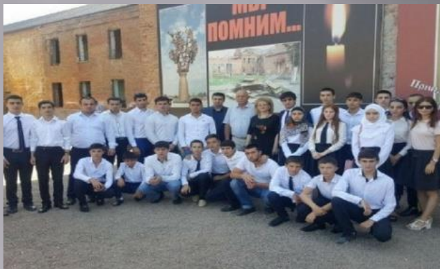
Воспитанники образовательных учреждений Республики Дагестан в Беслане

В этом направлении Мининформом РД проведены такие мероприятия, как Установка инсталляции «Рука мира» в парке имени Воинов-интернационалистов; Проведение мероприятия «Капля надежды»; Организация выездной акции в Республике Северная Осетия – Алания (г. Беслан); Проведение Вахты Памяти в городе Буйнакске, приуроченной к годовщине теракта 1999 года; Посадка «Аллеи мира» имени погибших журналистов Республики Дагестан Организация республиканской информационно-просветительской уличной акции «Нам нужен мирный Дагестан».