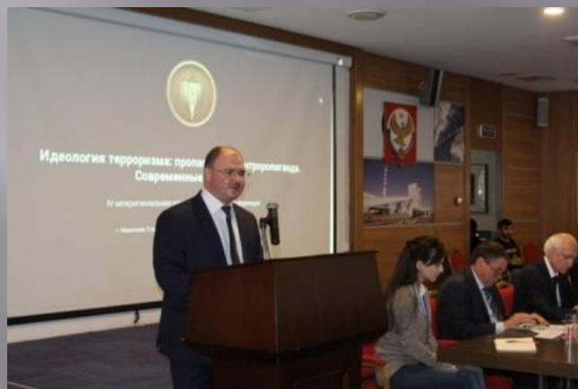
Выступающий на конференции в Сарыкуме